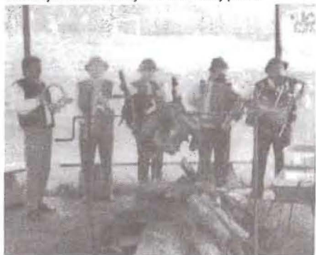
* Goralská muzika a pred ňou baran na ražni.

To, čo chceme od našich holubov - aby sa priamou cestou vracali na svoj holubník, to by sme sa mali naučiť aj my, chovatelia. Hľadať cestu k úspechu, k vynikajúcim výsledkom len v priamej, čestnej a svedomitej chovateľskej práci.