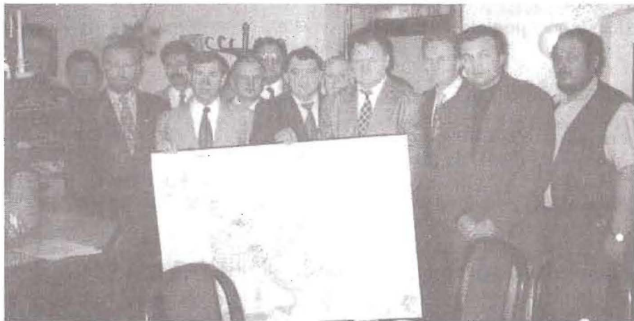
● Účastníci historického jednania

Dňa 16. novembra 1997 bol založený za účasti predstaviteľov Rakúska, Maďarska, Poľska, Česka a Slovenska STREDOEURÓPSKY MARATÓN CLUB