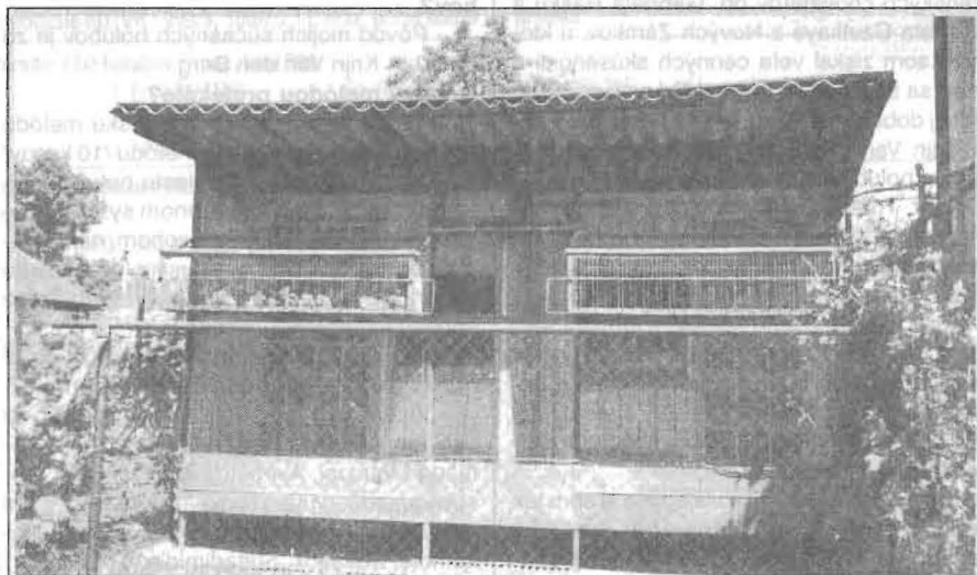
▲ Záhradný holubník 5 x 2 metre.

zmenil, ale rešpektujem názor väčšiny. Najviac ma trápi, že majstrovstvo Slovenska môžeme vyhodnocovať len z výsledkov v rámci OZ. Napríklad, u nás jedno auto vozí holuby z Galanty, Serede, Tek, Breznice, Dolnej Nitry a Levíc. Naraz sa holuby vypúšťajú, máme spoločné deklarované výsledky. V majstrovstve Slovenska však tieto výsledky použiť nemôžeme. Veľkú výhodu tak majú veľké oblasti a menšie sú znevýhodňované. Keby sa uvedené OZ zlúčili, zmenil by sa len názov OZ, ale poloha holubníkov určite nie.