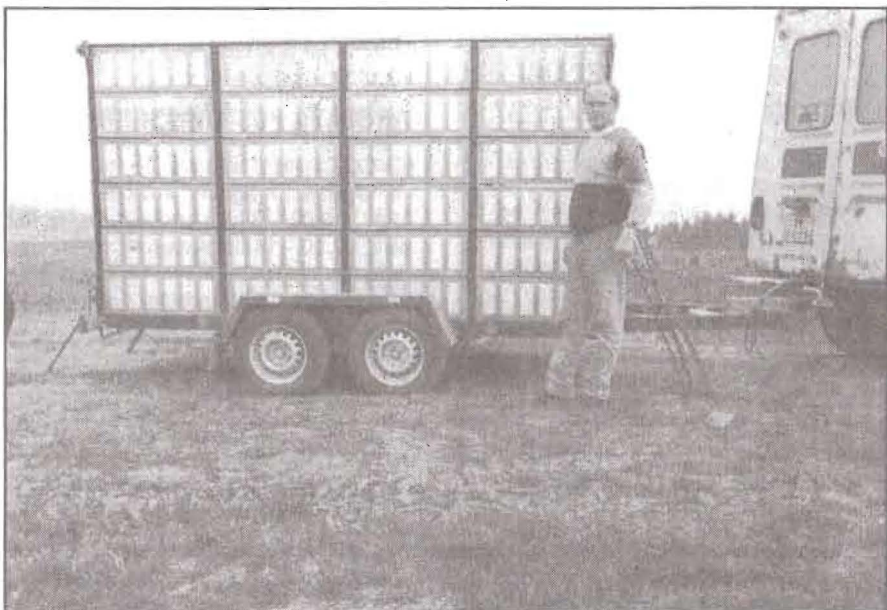
● OZ CHPH Tvrdošín si postavilo nový príviesný vozík na prepravu holubov.