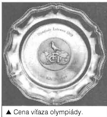
▲ Cena víťaza olympiády.

Je všeobecne známe, že chov štandardných holubov si od chovateľa vyžaduje náročnosť na každého jedinca, trpezlivosť, dôslednosť a húževnatosť spojenú s náročnosťou. Musí však byť aj tvrdý pri jesennom výbere a selekcii, lebo prezimovať by mali len tie najlepšie.