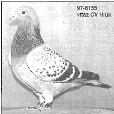
97-6155 víťaz CV Hluk

Predám holúbätá, kvalitné po stránke stavby tela, ročník 2005 od rodičov štandardných poštových holubov – osem z prvého hniezda a z ďalších podľa požiadaviek záujemcu.