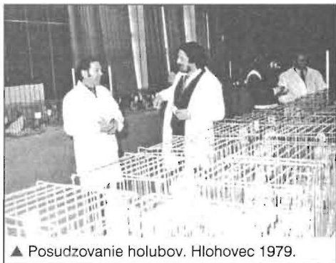
▲ Posudzovanie holubov. Hlohovec 1979.

Píšem na túto tému aj preto, aby som pripomenul tým našim posuzo-