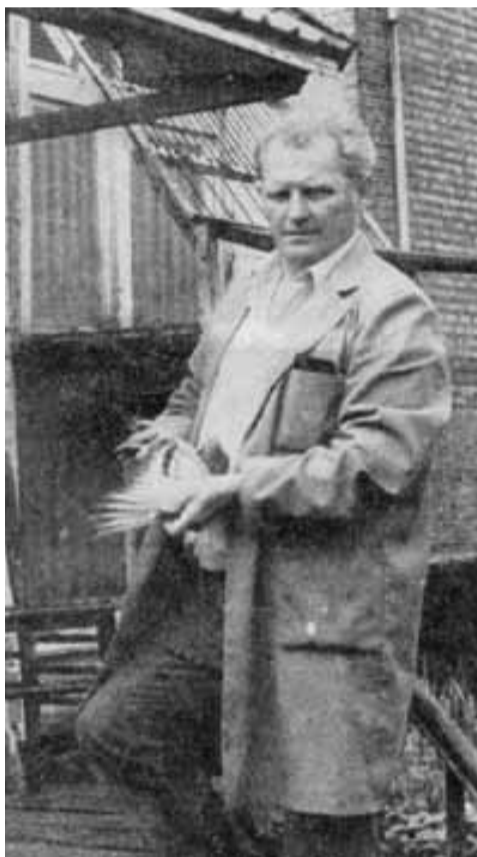
Gust in volle fleur (1984).

Gust: "Biljarten was natuurlijk plezant maar ik hield toch het meest van de duiven. Quiévrain en Noyon zijn altijd mijn favorieten geweest maar mijn duiven kunnen zeker verder. In 1997 liet ik me overhalen om verder te spelen. Ik ging voorzichtig met een mandje van twee duiven om de degens te kruisen met de grote jongens van Union Anwerpen. Het waren duivinnen die hun mannetje(!) konden staan. Het beste vloog drie keer kop op de halve fond en werd asduif... om het seizoen af te ronden speelde ik het duivinetje op Bourges en poulde haar drie keer tot 1000. Het is mijn Bourgesduivin die later uitgroeide tot een superkweekduivin."