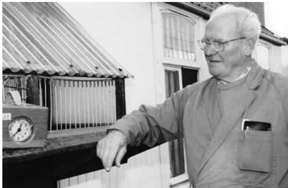
De duiven gaan komen. De klok staat al klaar.