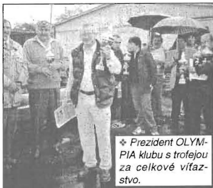
❖ Prezident OLYMPIA klubu s trofejou za celkové víťazstvo.