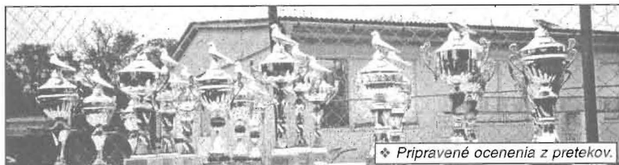
♦ Pripravené ocenenia z pretekov.