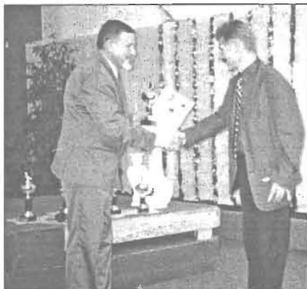
❖ Častý obrázok z odovzdávania ocenení.