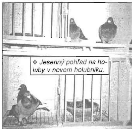
❖ Jesenný pohľad na holuby v novom holubníku.

percent chýbalo aj 6% holubov. Radi spíme. Zo štyroch dlhých tratí mal Lukáš sériu 10/8, 10/7, 10/7, 10/8. Nasadzoval na tieto trate 5 vdovcov, ktoré boli úspešné na 100%. Na dlhé trate boli nasadzované staršie holuby /96/, ale i dvojročné, tie prešli súťažami ako mláďatá, ročiaky a v druhom roku boli stopercentné.